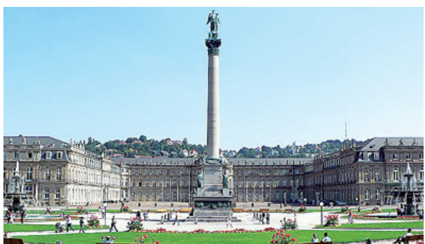
司圖加特：宮殿花園廣場 Stuttgart, Schlossplatz

（記者卓家羽／報導）連續三天的端午假期，不少民眾與親朋好友們一同出遊，因此全國各大景點都人山人海，高速公路上也塞成一團，令許多的遊客們敗興而歸，每當有連續假期時，總會有不少的交通問題，這些年，同樣的問題一直都存在，造成許多觀光景點的公共設施（如公共停車場）無法負荷大批的人潮而政府拿不出一套解決的方法，而在許多的歐洲國家，為了解決類似的交通問題，已有