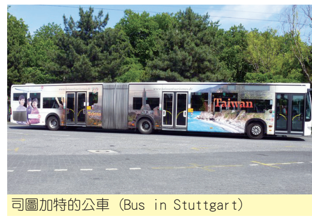
司圖加特的公車 (Bus in Stuttgart)